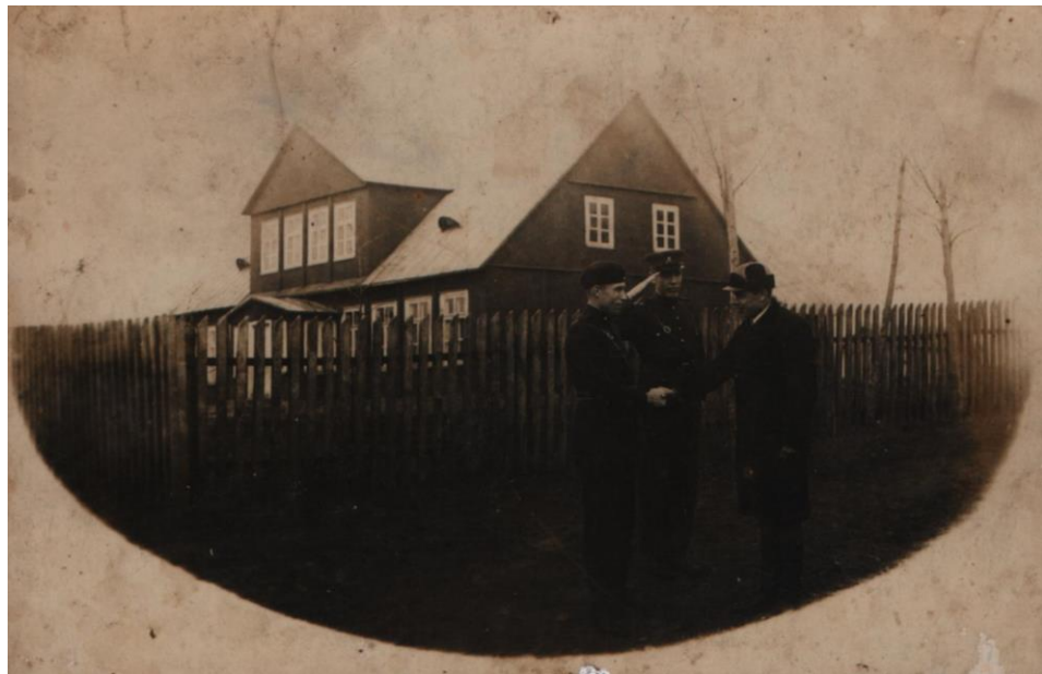
1925 m. pastatyta Gražiškių pradinė mokykla iš pietryčių pusės.

1925 metais pastatyta nauja medinė mokykla, kurioje mokėsi 6 skyriai. Vienoje I aukšto klasėje mokėsi I ir III skyriai, kitoje klasėje – II ir IV skyriai, o II aukšte – mansardoje – V ir VI skyriai.