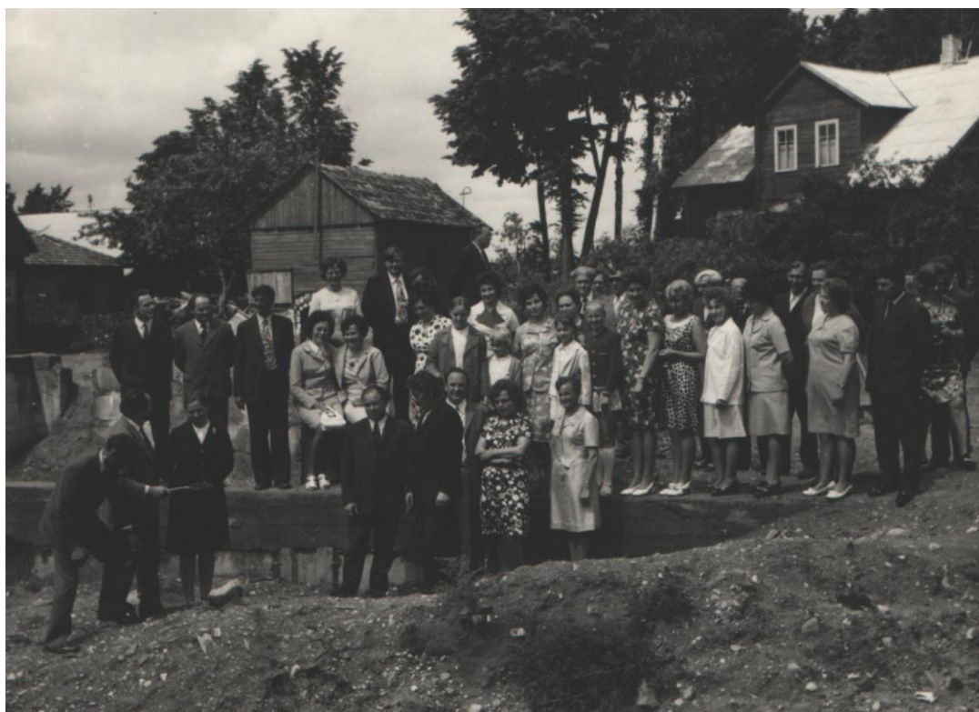
II laidos abiturientų susitikimo dalyviai prie pradėtos statyti naujos mūrinės mokyklos pamatų 1974 m. liepos mėn. (20 metų po mokyklos baigimo).