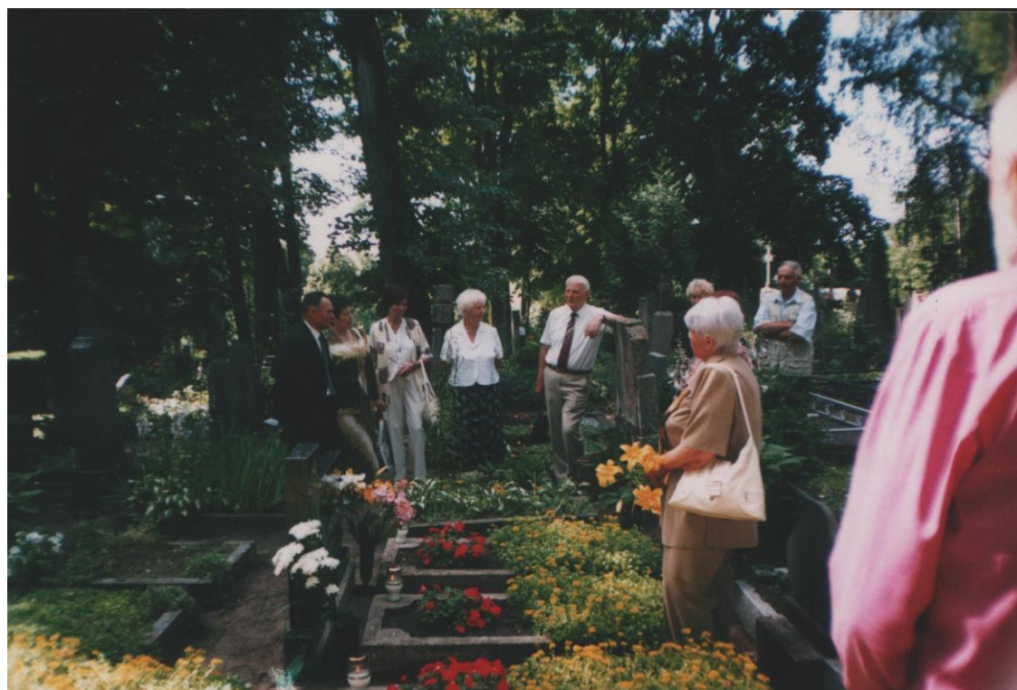
III laidos abiturientai (1955 m.) prie mokyklos Vinco Kasperaičio kapo 2005 m. liepos mėn.