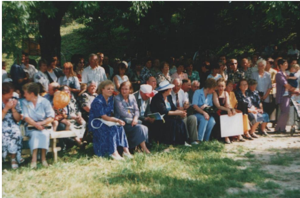
Gražiškių įkūrimo 400 metų jubiliejaus ir vidurinės mokyklos jubiliejinės 50 – osios laidos išleidimo šventės dalyviai 2002 m. liepos 20 d.