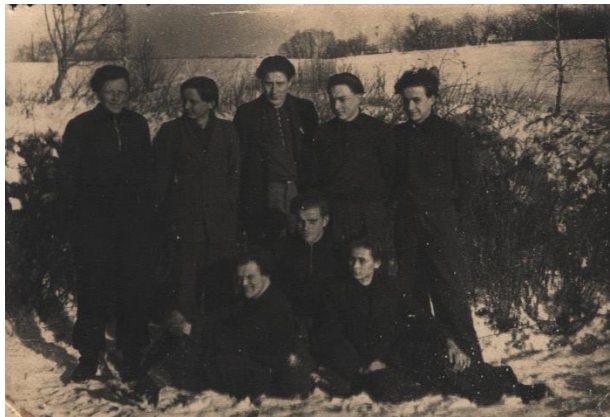
III laidos berniukai 1948 m. gruodžio mėn.