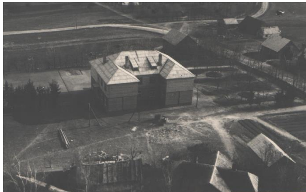
Nauja mokykla iš šiaurės pusės. Fotografuota iš bažnyčios bokšto. 1953 m.