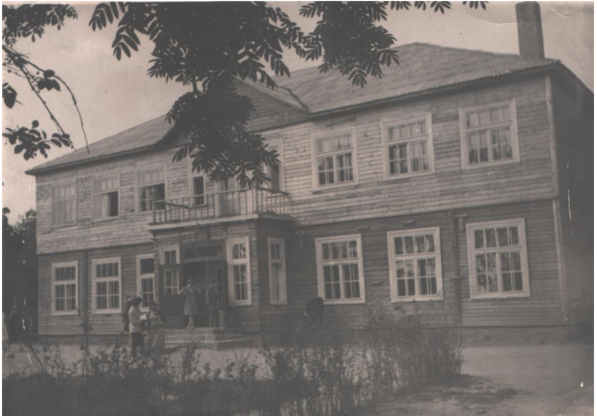
1951 metais pastatyta nauja vidurinė mokykla, į kurią buvo persikelta iš buvusios progimnazijos patalpų.