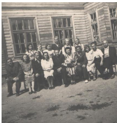
I laidos likučiai – 6 mokiniai antroje eilėje – su pedagogų kolektyvu 1953 m. liepos 3 d.