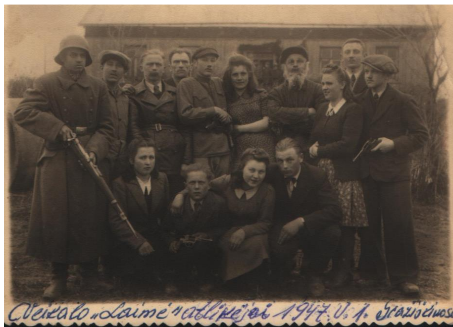
Dramos būrelio nariai, veikalo „Laimė“ vaidmenų atlikėjai. 1947 m. gegužės 1 d.